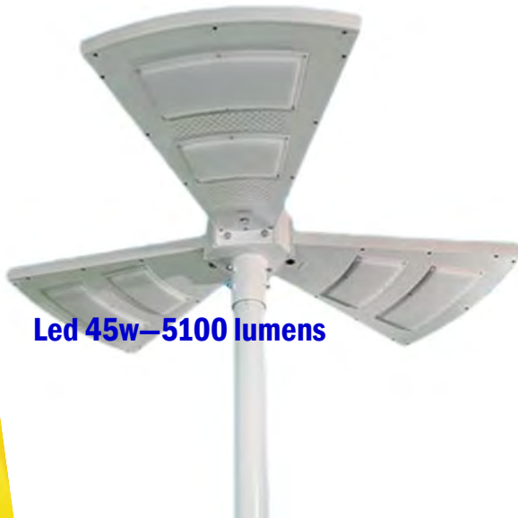
Led 45w—5100 lumens