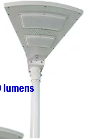
Led 15w—1700 lumens