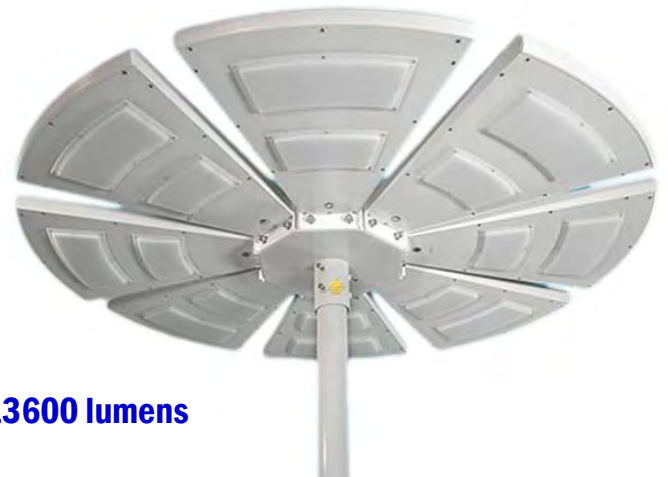
Led 120w—13600 lumens