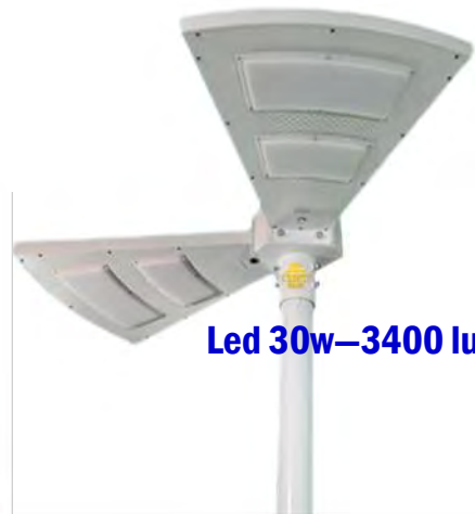
Led 30w—3400 lumens