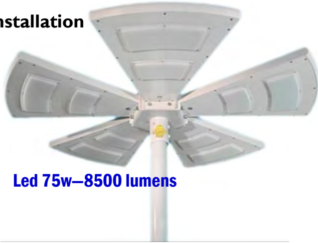
Led 75w—8500 lumens